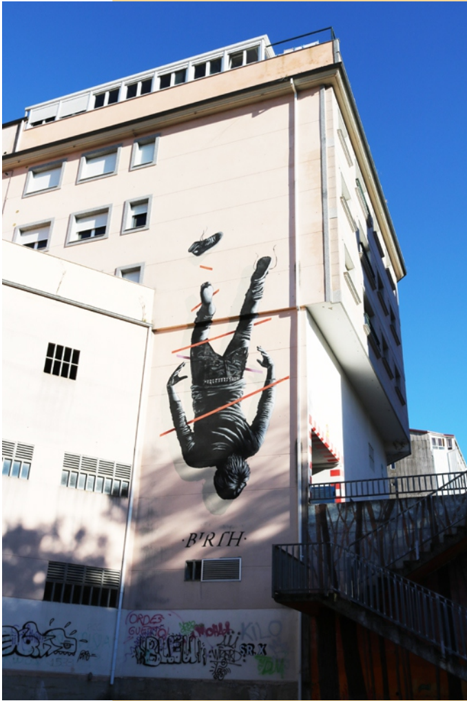
"Birth", Sr. X