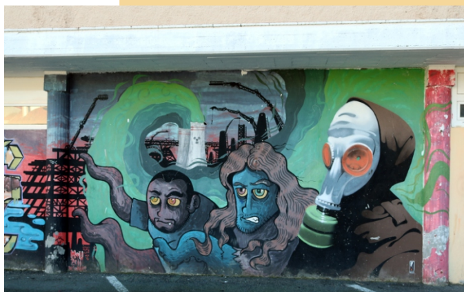
Xpen, Mou e ISI