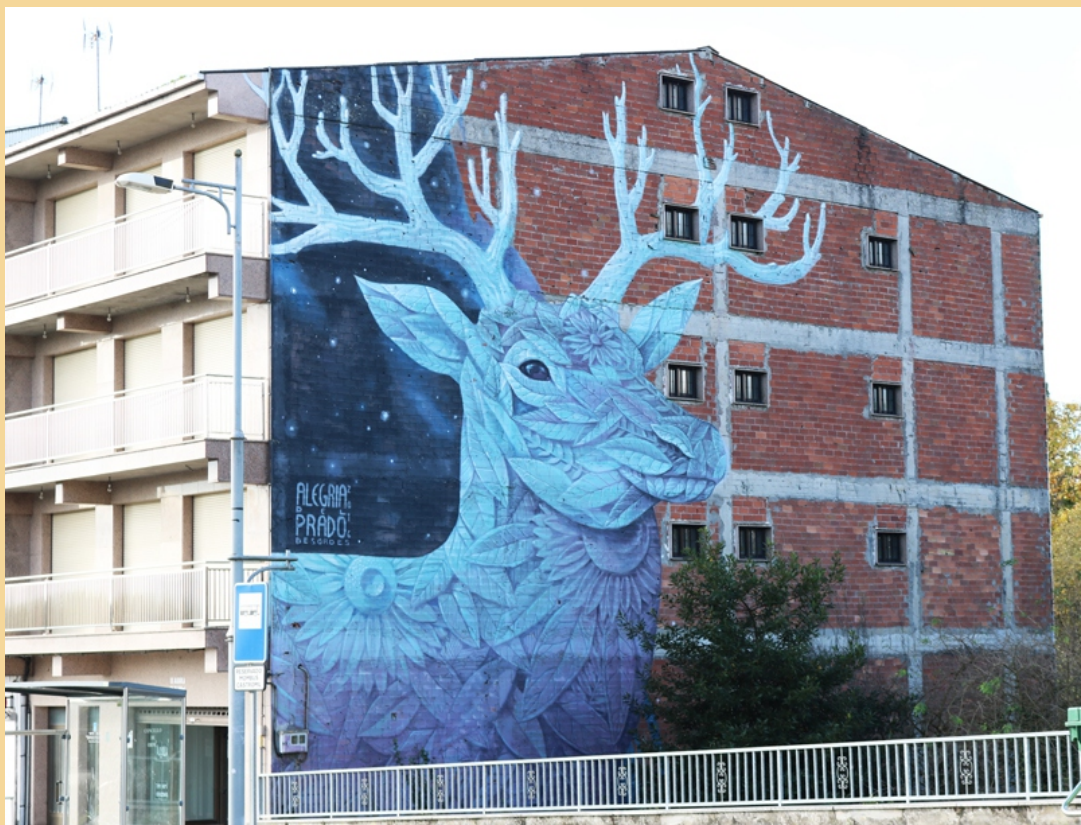
Alegría del Prado