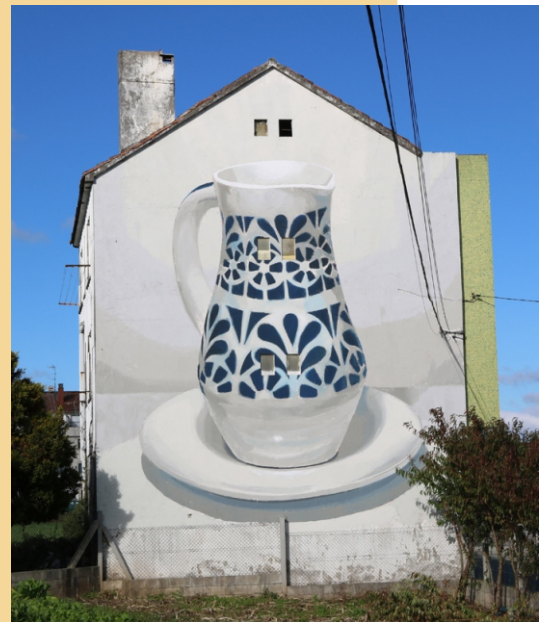
“Xerra de auga limpa...” Manolo Mesa