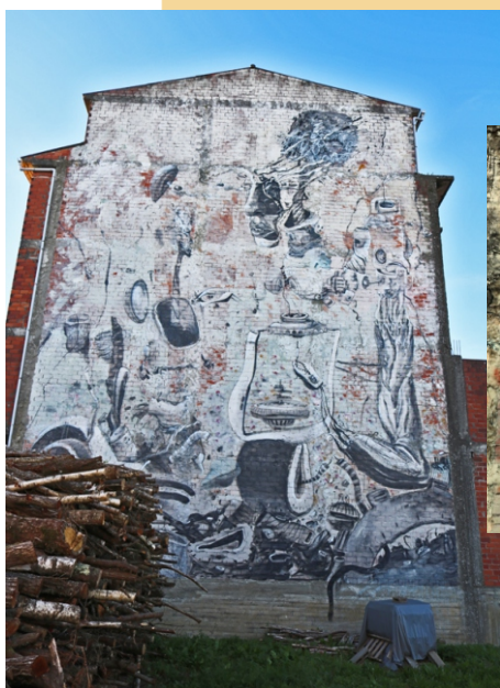
"Memoria sobre ladrillo" Laguna