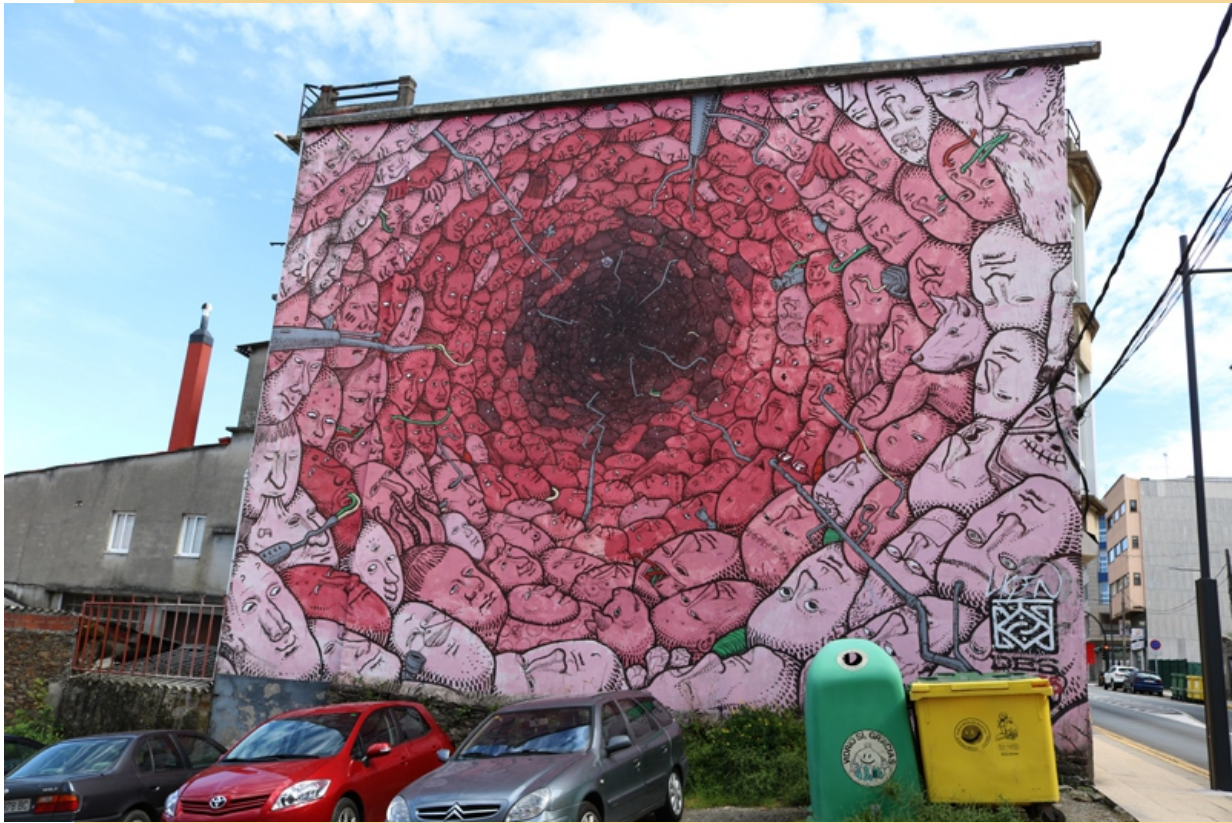
"Buraco vermello", Ligen