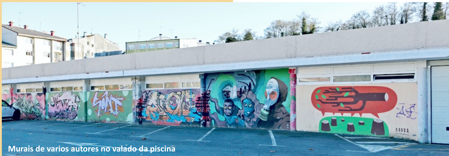
Murais de varios autores no valado da piscina

http://certamedesordescreativas.blogspot.com/p/blog-page_2.html