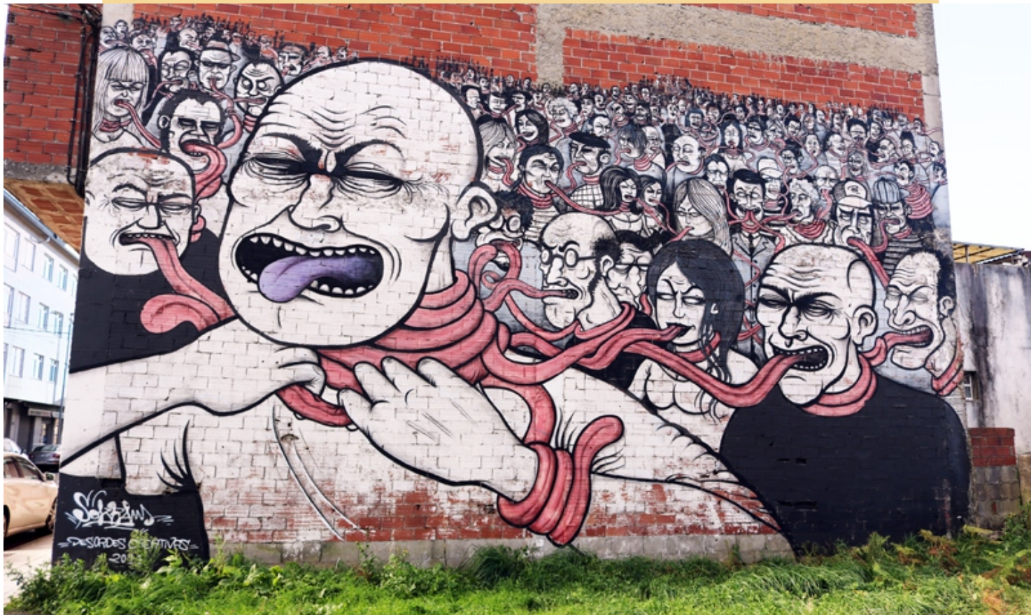
"Malas línguas", Sokram