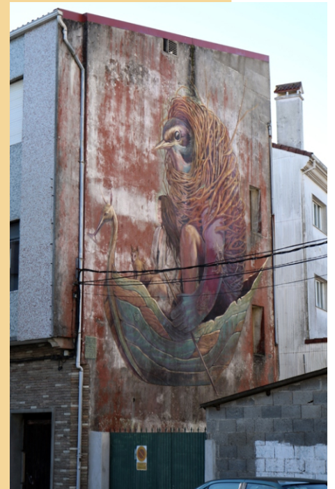
Alegría del Prado