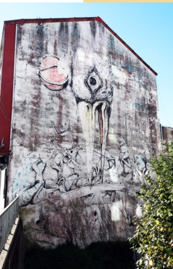
Blu Erika Il Cane