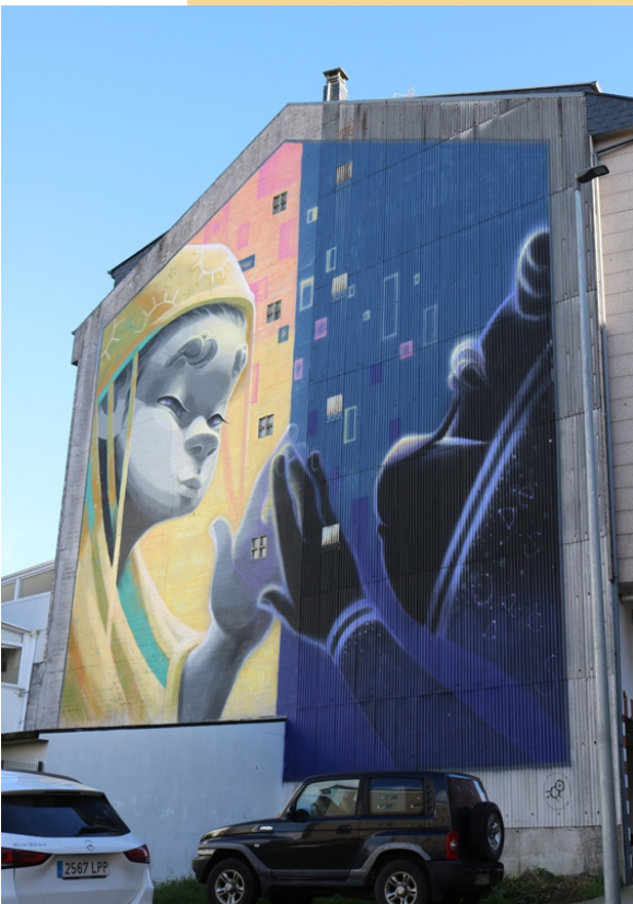
“Déixao pasar”, Animalito Land