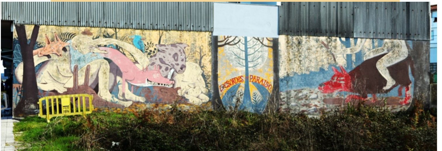
"DesOrdes no Paraíso", Nada