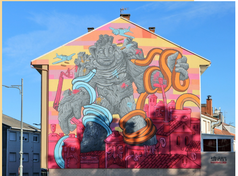
"Concrete Golem", Sokram