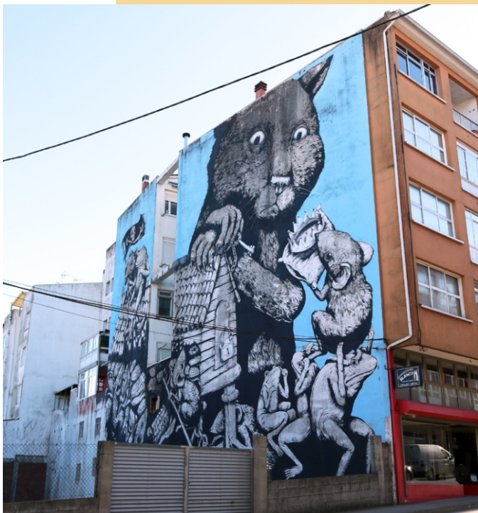
Erica Il Cane