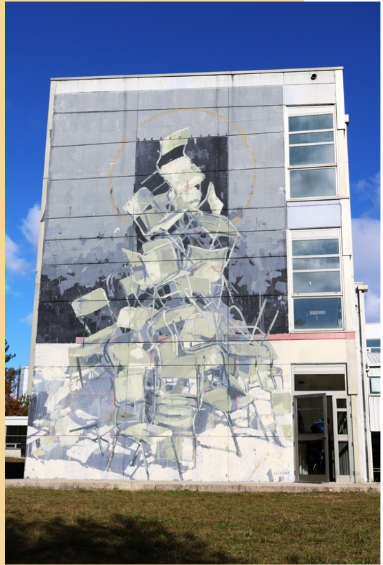
“Sacrum fieri” Borondo