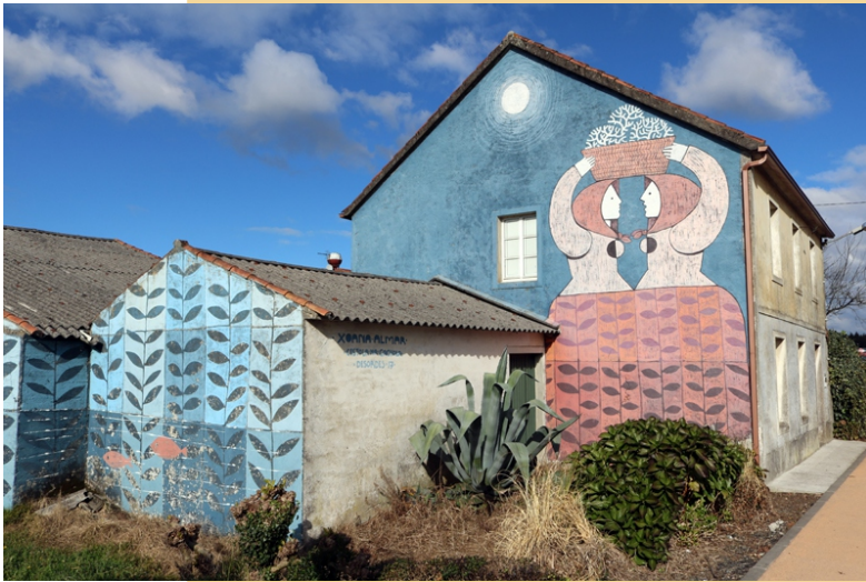
Xoana Almar (Cestola na Cachola)