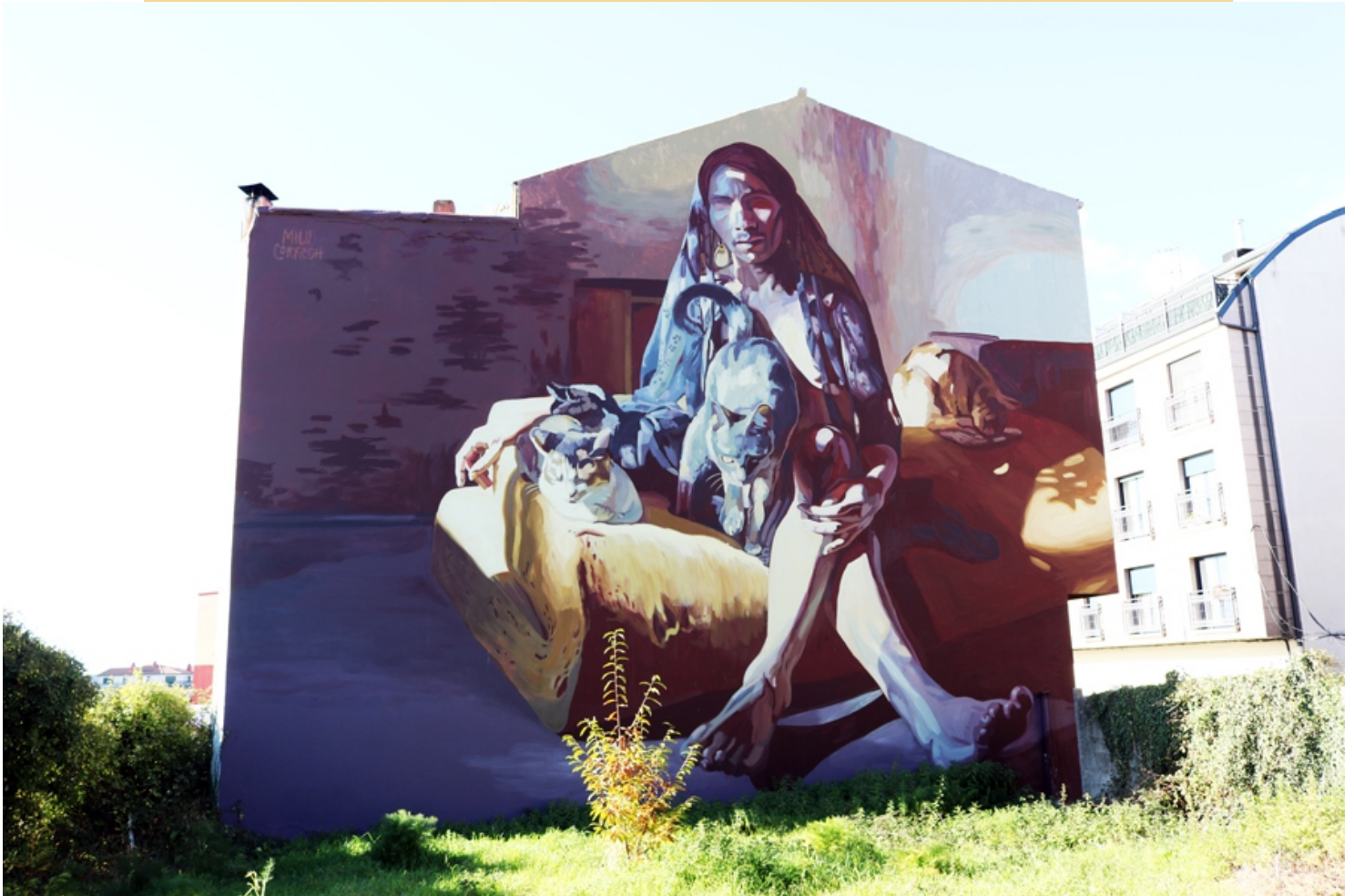
"Habelas hainas", Milu Correch