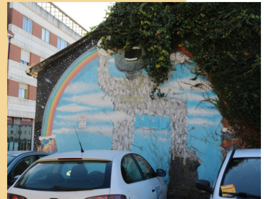
“Malicia canibal”, Tayone