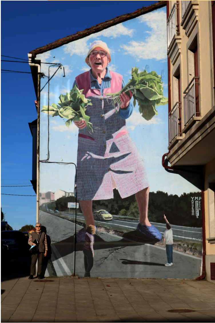
“A greleira de 50 pés”, Yoseba M P