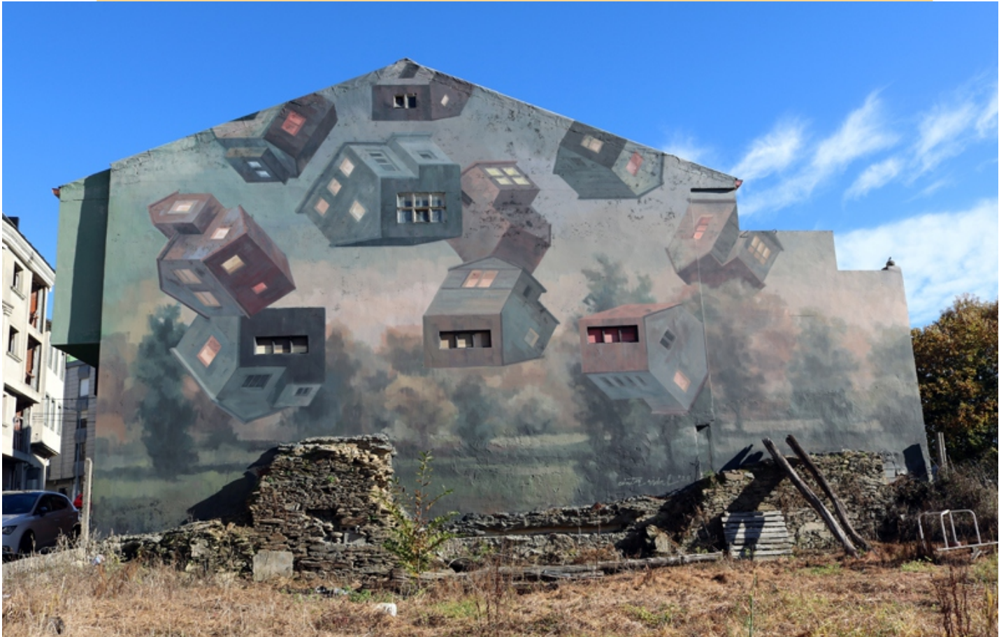
“A hora gris”, Cinta Vidal