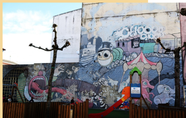
"Atracción fatal", Nas, Nana e Sokran,