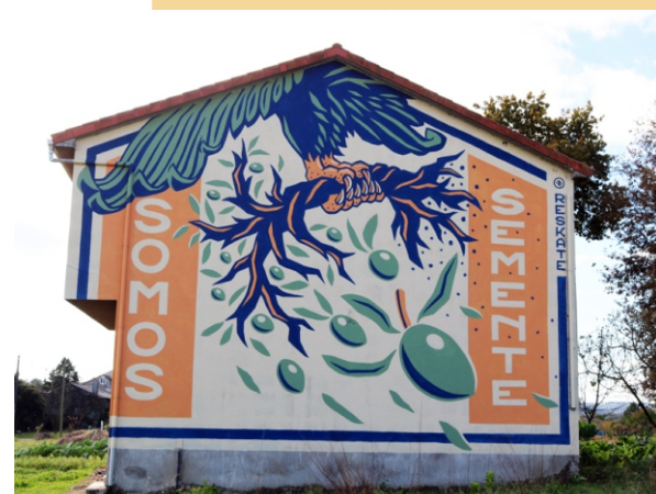
“Somos semente” Reskate