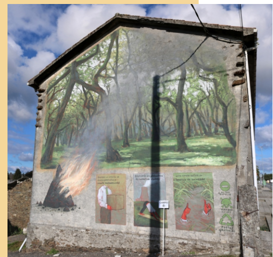
“Cortina de fume” Maz