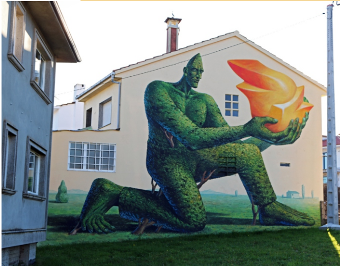
"Prometeo", Aecinteresni Kazki