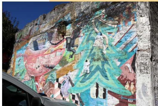
Pelucas (Feat e Sokram)