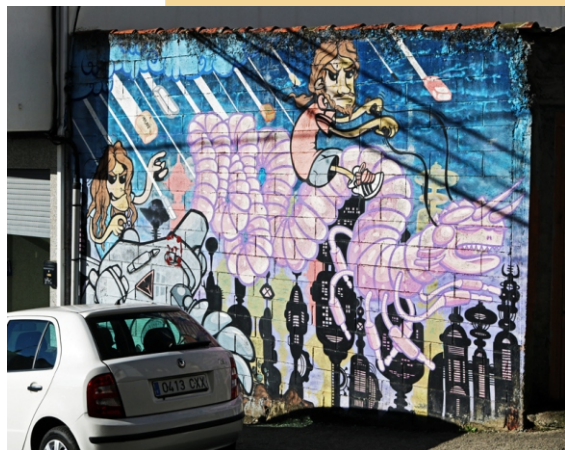
Mutante (Mou e Sokram)