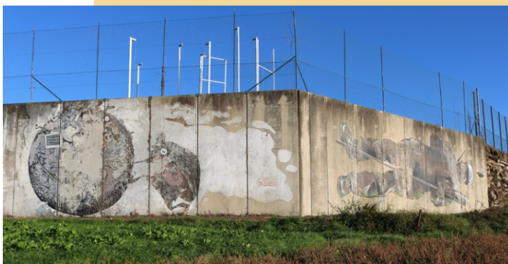
“O escaravello”, Nasi & Del