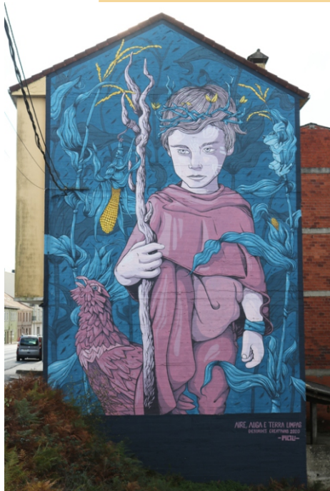
“Aire auga e terra limpas” Mou