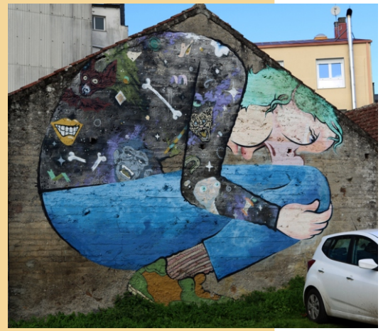
“O borrachín” Nano